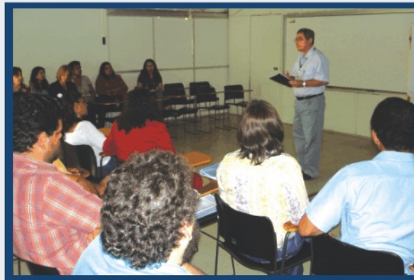
Reunião de trabalho sobre Orçamento Participativo

A Fundação também está tranquila quanto ao cumprimento do previsto na Resolução Nº 13, de 01/10/2004. "Tomamos todas as providências para atendimento pleno e, a